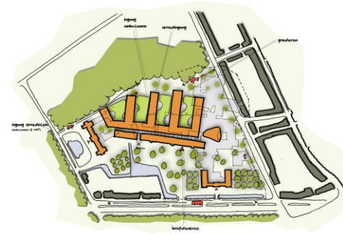
Ideeën over tweede fase